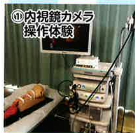
①内視鏡カメラ 操作体験