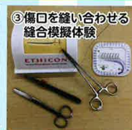
③傷口を縫い合わせる 縫合模擬体験