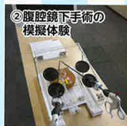
②腹腔鏡下手術の 模擬体験